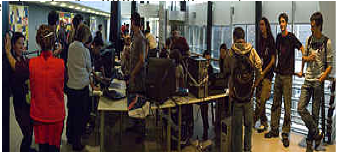
Área de instalación en diversos equipos Montevideo 2009.

Festival Latinoamericano de Instalación de Software Libre (FLISoL), es el mayor evento de difusión del Software libre que se realiza de forma anual en los países de