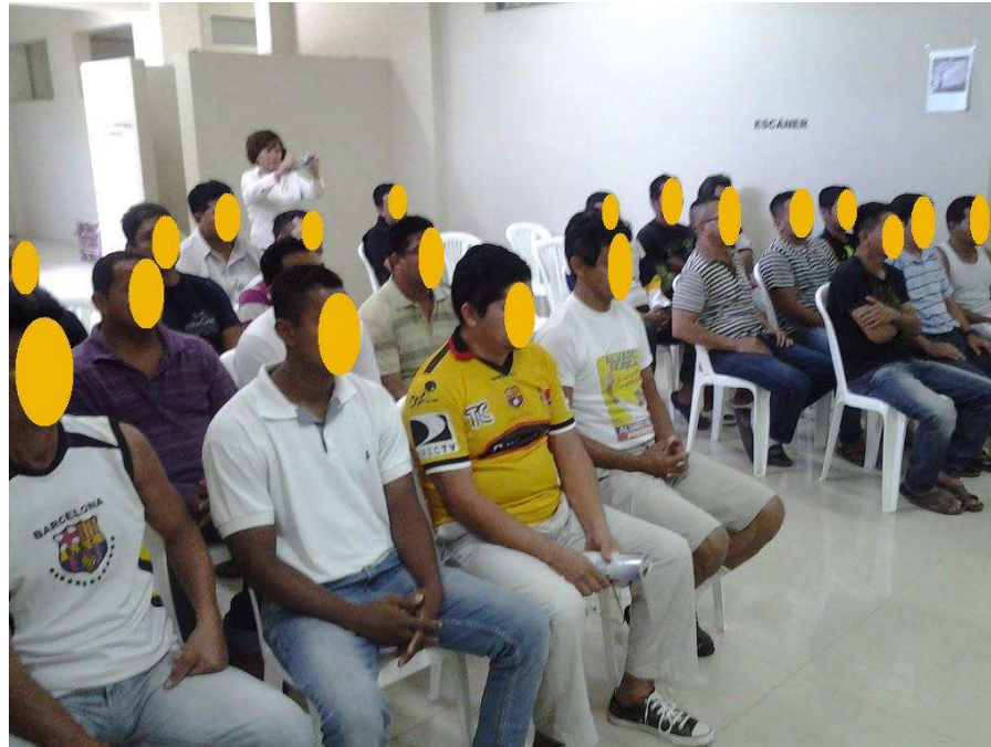
Participantes del proyecto durante la ceremonia de clausura del mismo.